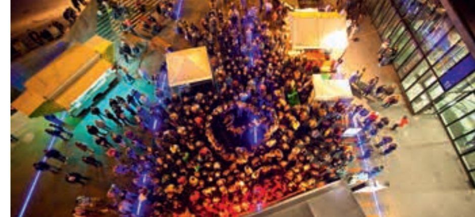
Event im Flon-Viertel, Lausanne